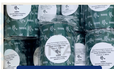
Mực In Mã Vạch