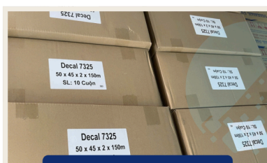
Decal In Tem Nhãn

Mã Vạch Số Vina (MVS Vina) là đơn vị chuyên cung cấp: