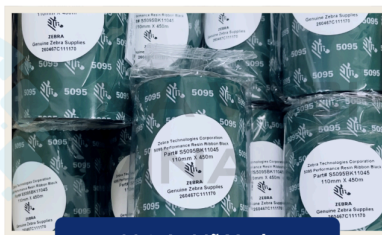
Mực In Mã Vạch