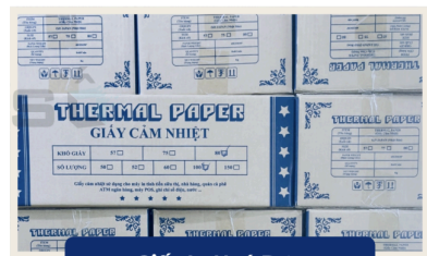
Giấy In Hoá Đơn

+ Mực in mã vạch + Tem nhãn deca + Máy in tem nhãn mã vạch