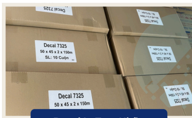
Decal In Tem Nhãn

Mã Vạch Số Vina (MVS Vina) là đơn vị chuyên cung cấp: